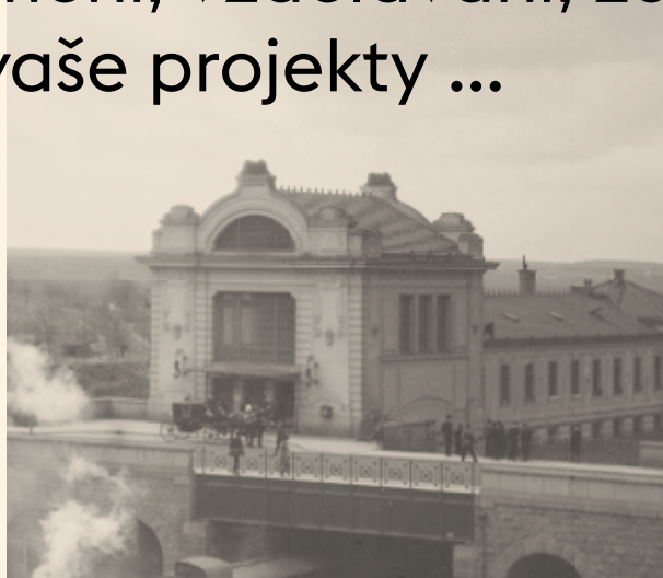
pohled na budovu zastávky na Říšském předměstí, 1905