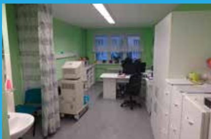
Modernizace chodeb, čekáren a ambulancí v 1. patře budovy CNP v PRIVAMEDU